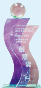
榮獲2011年度第四屆健康促進醫院典範暨創意競賽

因為我們對職場勞工健康的投入與努力，於今年4月榮獲高雄市工業會頒發「 榮獲2011年度第四屆健康促進醫院典範暨創意競賽 」，同年9月再以「企業遠距健康照護管理服務計畫」參加臺灣健康醫院學會2011年度第4屆健康促進醫院典範暨創意競賽，獲得「特優獎」殊榮。此外，本院為全國第5家承辦勞保局職災勞工職業輔導評量計畫單位（全台共計10所醫院執行），也是南高雄唯一承辦單位。另於今年10月份通過健康促進醫院認證，各界的肯定與鼓勵也是我們持續提昇的重要支持。